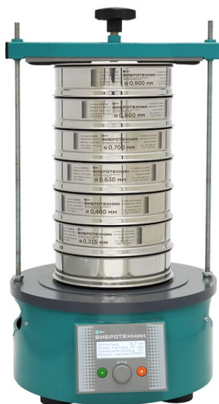
Рис. 2. Анализатор А 20 на базе Вибропривода ВПС