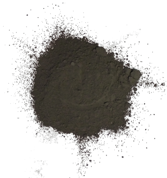
Рис. 4. Продукт истирания