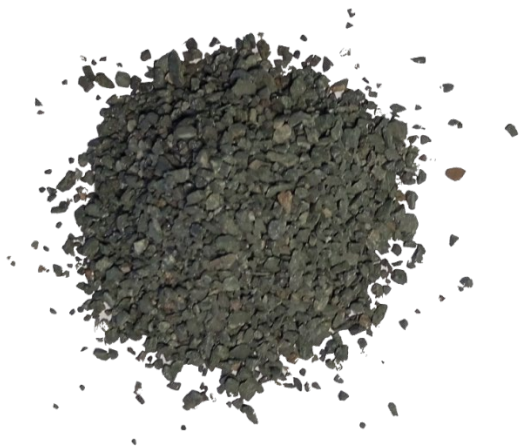
Рис. 3. Материал до истирания